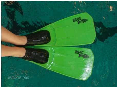
Seac Sub Seastar en soortgelijken

Hier een paar voorbeelden van goede en minder goede flippers, in volgorde van heel goed naar steeds minder goed: